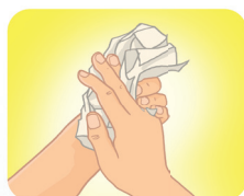
Seque as mãos com papel toalha descartável.