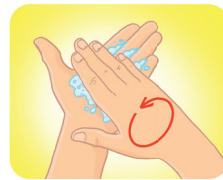
Ensaboe as palmas das mãos, friccionando-as entre si.