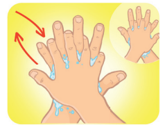
Esfregue a palma da mão direita contra o dorso da mão esquerda, entrelaçando os dedos, e vice-versa.