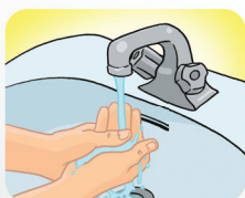
Enxague bem as mãos com água.