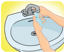
Molhe as mãos com água.

Mãos: toda vez que você lava, ganha saúde.