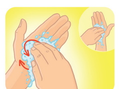
Friccione, fazendo movimento circular, as polpas digitais e as unhas da mão direita contra a palma da mão esquerda, e vice-versa.