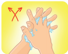
Entrelace os dedos e fricione os espaços interdigitais.