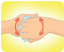
Esfregue o dorso dos dedos de uma das mãos com a palma da mão oposta, com movimentos de vai e vem, segurando os dedos, e vice-versa.