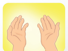
Agora, as suas mãos estão limpas.

15 de outubro Dia Mundial de Lavar as Mãos