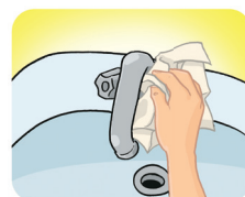
Utilize sempre o papel toalha para fechar a torneira e jogue-o no lixo após o uso.