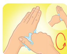
Esfregue o polegar esquerdo, utilizando-se de movimento circular, com o auxílio da palma da mão direita, e vice-versa.